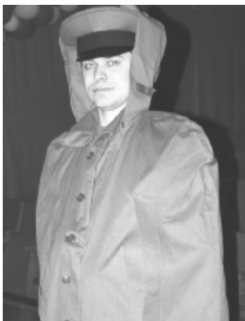
Рисунок 9 - Л. Толстой периода «Севастопольских рассказов» в исполнении асс. О. В.Скрипникова

Толстой был убежден, что без улучшения прежде всего внутреннего мира человека всякое общественное переустройство ни к чему хорошему не приведет. «Не Россию надо спасать, а то, что в миллион миллионов раз дороже – свою душу!» – призывал он.