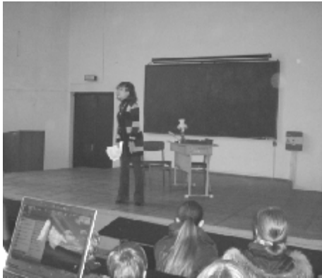
Рисунок 8 – Слово о Чехове

Ну а предварял все действие, разумеется, рассказ о Чехове (рис. 8).