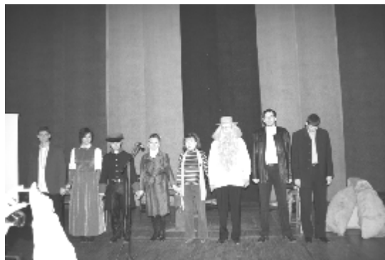
Рисунок 13 – Финальный выход к благодарной публике