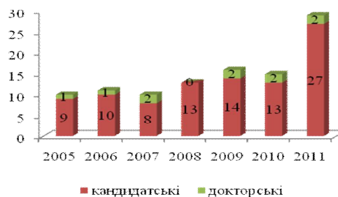
Рисунок 1 – Динаміка захистів кандидатських та докторських дисертацій

Результати виконання положень цієї Концепції значною мірою визначаються якісним складом кадрів вищої кваліфікації, що, у свою чергу, формує якість освіти та імідж університету як науково-освітнього закладу. На сьогодні серед викладачів університету працюють 54 доктори наук (з них 50 професорів) і 172 кандидати наук (з них 140 доцентів). Тільки протягом 2011 року науковці університету захистили 27 кандидатських та дві докторські дисертаційні роботи (рис. 1). На сьогодні в університеті функціонують дві докторські спеціалізовані вчені ради за чотирма спеціальностями та чотири кандидатські ради за шістьма спеціальностями.