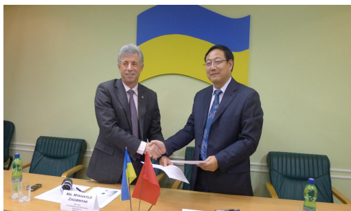
Рисунок 3 – Підписання договору про співробітництво ректором КрНУ М. В. Загірняком та ректором Ланьчжоуського університету шляхів сполучення Реном Ененом

Наприкінці листопада 2011 року у рамках договору про співпрацю між нашим університетом та Ланьчжоуським університетом шляхів сполучення відбувся Перший українсько-китайський круглий стіл «Регіональний сталий розвиток та його роль в освіті» (рис. 3), у якому взяла участь делегація з університету Ланьчжоу на чолі з ректором проф. Реном Ененом. Проведення круглого столу – важливий етап у розвитку ефективної, плідної та довготривалої співпраці між університетами. 2011 року вперше четверо наших аспірантів отримали стипендію «Leonhard-Euler Program 2011/2012», що надається Німецькою службою академічних обмінів (DAAD), терміном на дев'ять місяців. На завершальному етапі стипендіальної програми аспіранти проходили місячне стажування в німецькому університеті. Тринадцять співробітників університету, серед яких три викладачі, п'ять аспірантів і п'ять студентів, 2012 року перемогли в конкурсі Міністерства освіти і науки, молоді та спорту України й отримали змогу поїхати за кордон у рамках бюджетної програми 2201250 «Навчання, стажування, підвищення кваліфікації студентів, аспірантів, науково-педагогічних та педагогічних працівників за кордоном».