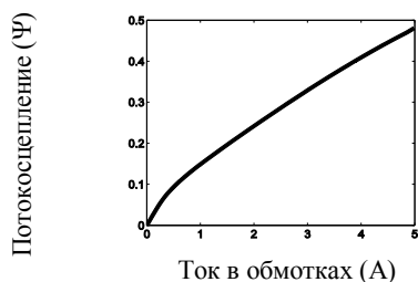
Рисунок 1 – Название рисунка

МАТЕРИАЛ И РЕЗУЛЬТАТЫ ИССЛЕДОВАНИЙ. Рисунки выполняются черно-белыми или в оттенках серого. Оси на графиках должны иметь поясняющее название (рис. 1).