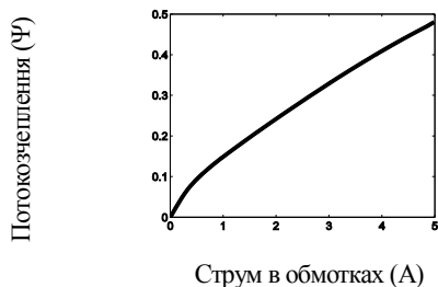
Рисунок 1 – Назва рисунку

Рисунки подаються чорно-білими або у відтінках сірого. Вісі на графіках повинні мати пояснювальну назву (рис. 1).